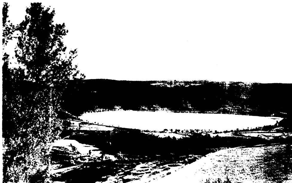
133. LAC D'ISSARLES (Ardèche), alt. 1.000 m. - Vue panoramique - Superficie 91 hectares. Circonférence 5 kil. - Profondeur 138 m. - Ancien cratère de volcan.

Ce projet ambitieux ne fut jamais réalisé. Cependant, durant la période 1950/1954 fut creusée une canalisation souterraine susceptible d'évacuer les eaux du lac, on a modifié le cours de La Veyradère, du Gage de la Loire qui peuvent ainsi augmenter la réserve enserrée dans le cratère d'Issarlés. C'est dire que l'édification de l'usine hydro-électrique de Montpezat apportait aux projets d'Eugène Mouline et du Dr Prompt une part de vérité. Et quelle vérité lorsqu'on sait que le barrage de retenue, ouvrage principal, est situé à La Palisse !!