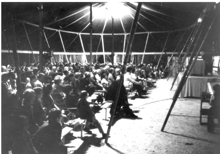
Mission de 1983