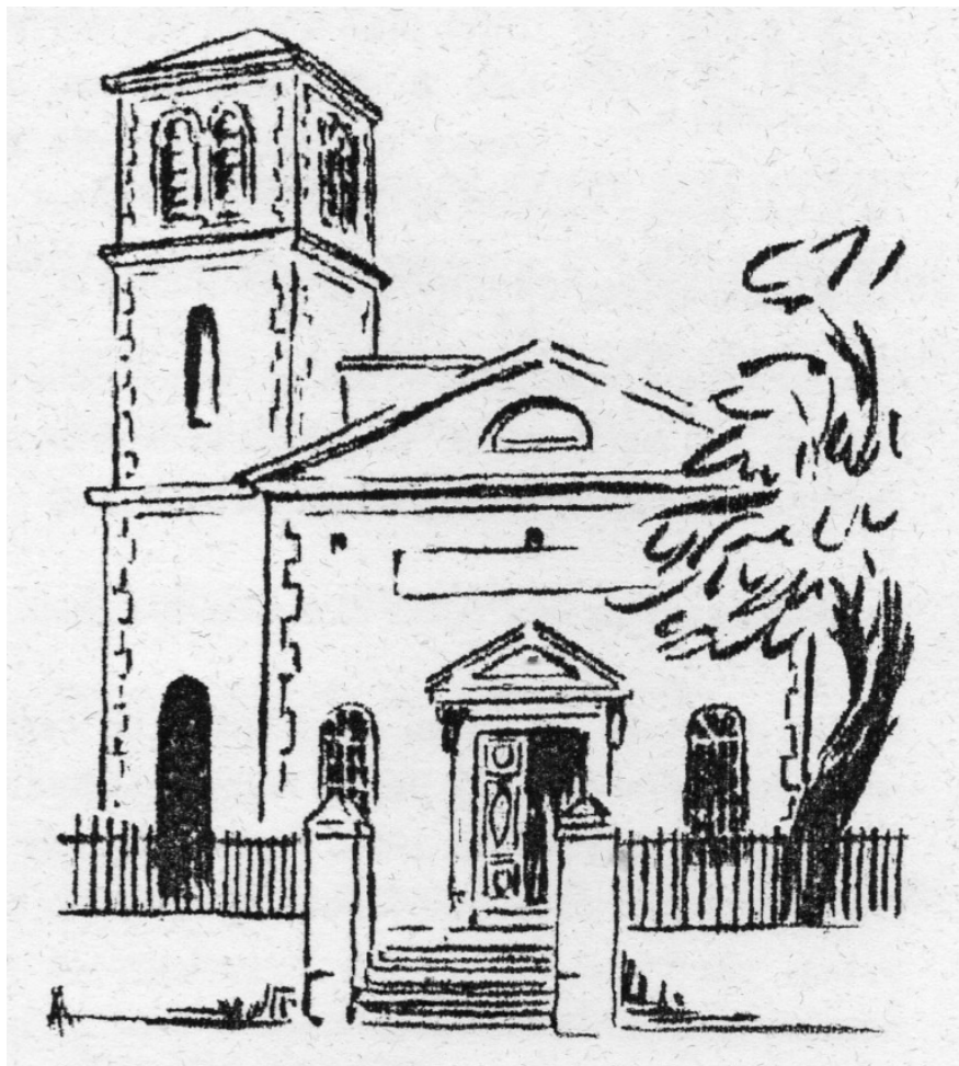
Temple de Privas (Michel Pontier)

que les protestants ont « toujours vécu avec les catholiques en grande concorde » et qu'ils sont « des gens de probité ».