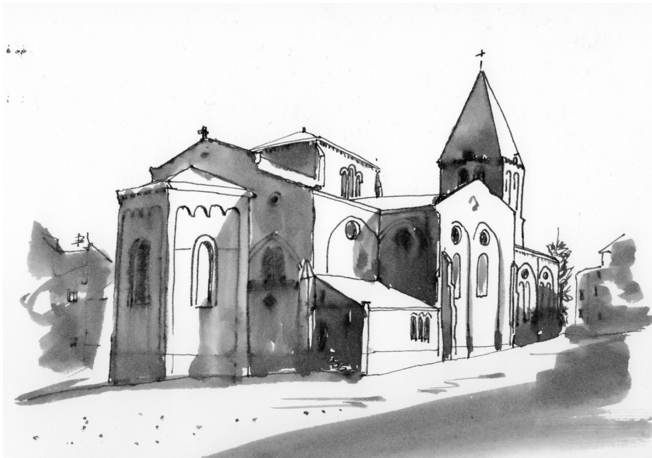
Eglise saint Thomas (P. G.)

- 1872, construction d'une « maison d'école » pour les élèves protestants des deux sexes à Privas.